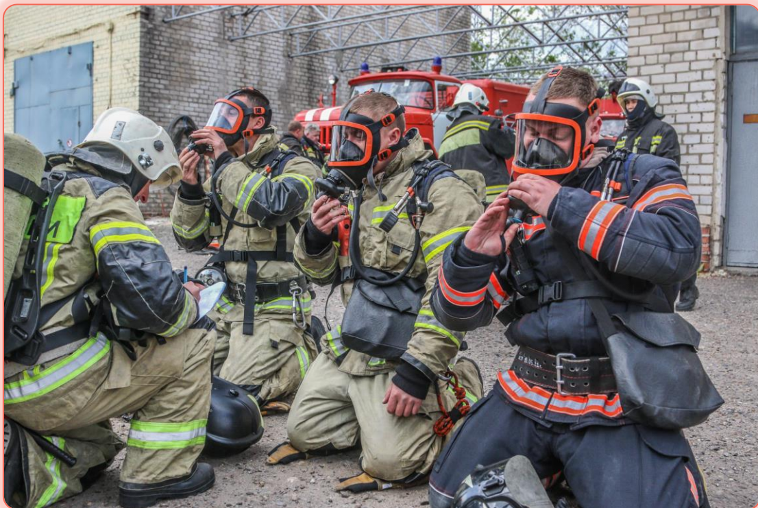
Звено газодымозащитной службы